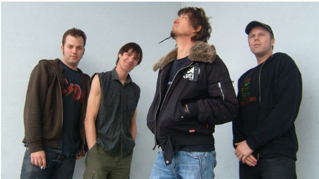
The Bucks: Drummer Pädé und Sänger/Bassist Rams (2. und 3. v.l.) machen seit über 30 Jahren zusammen Musik.

«The Bucks rennen nicht auf jede Scheissbühne», heisst es in der Band-Bio. Dennoch werden sie in den kommenden Tagen einige Shows in ausgewählten Clubs zeigen. Hingehen lohnt sich unbedingt. Das Kraftpaket von «More is More» wird live seinem Namen alle Ehre machen. Die neue CD kaufen lohnt sich unbedingt. (zum)